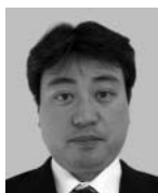
横溝正人（よこみぞ まさと）

This paper examines general satellite ground systems, the ground systems for GOSAT, as well as the systems, computers and middleware for which Fujitsu is responsible. The paper also describes the ground systems for determining orbits and planning observation in particular detail, given Fujitsu's major contribution to such systems.