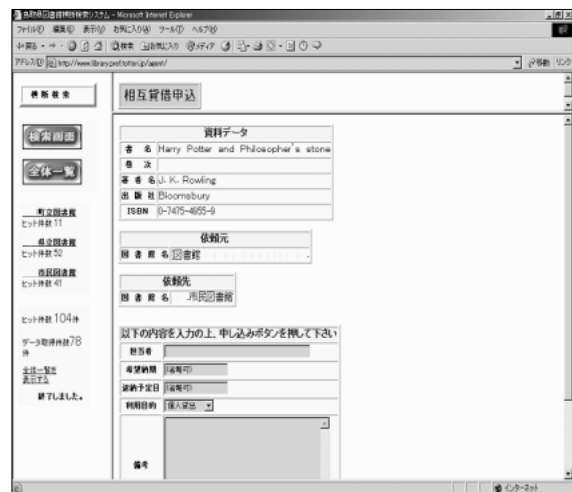
図-6 相互貸借申込画面 Fig.6-Screen of interlibrary loan.

いる情報だけでは不足する可能性がある。富士通では、横断検索用の独自開発プロトコル（ICCAP：Integrated Catalogue information Crossing Access Protocol）を決め、表示する情報より多い情報を受け取って、より精度の高い同定作業も横断検索システム「iLisSurf」で可能な構成としている。