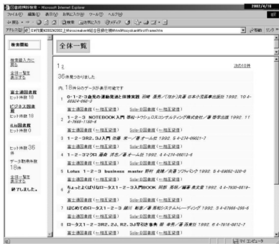
図-5 蔵書の検索結果 Fig.5-Search result from book catalogs.