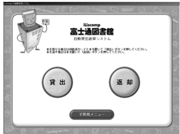
図-3 自動貸出装置メニュー画面(例) Fig.3-Menu panel of automatic lending system (sample).

蔵書点検作業は、バーコードで処理する場合には、資料を一度、棚から取り出してスキャンする必要が