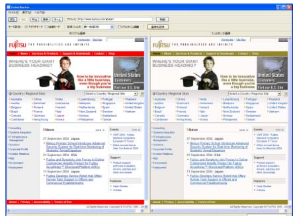
(注) ウィンドウを2分割し、左半分はWebページ、右半分は色覚障害者の見え方に変換した画像が表示される。

従来から色覚障害者の見え方に変換表示するソフトウェアは存在していたが、それらは文字や静止画のみで、動画の変換はできなかった。一方、WebページにはFlashなど動きのあるページが多く見られるようになった。ColorDoctorではこれらの動画ページもリアルタイムに変換表示しチェックすることができる。リアルタイム変換は、静止画の変換を短い間隔で連続して行うことで実現している。この間隔が短いほど変換した動画の動きはなめらかになるので、1回の変換に要する計算時間を毎回測定し、Webページ表示の動作環境に応じて間隔を自動的に調整するようにした。