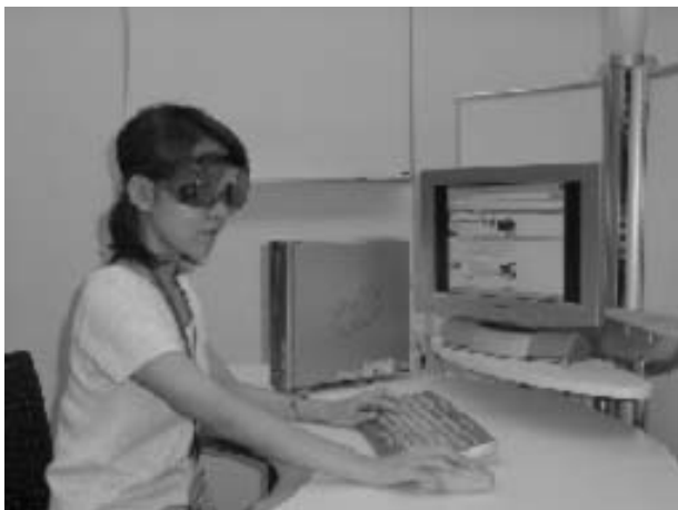
図-2 擬似白内障の被験者

Fig.2-Goggles that simulate vision of person having cataracts.