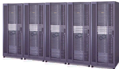
富士通のPCクラスタ製品体系

また、HPCシステムをさらに使いやすくする可視化、グリッドなどのソリューションもご提供しています。