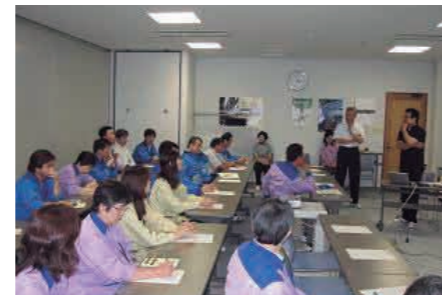
環境講演会 「会津盆地における野生動物の保護と管理」