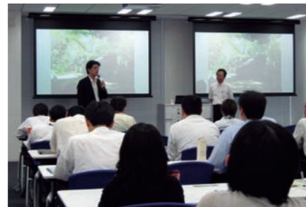
環境講演会 「縄文スローライフ」

またIT関連企業は、持続的かつ健全なマーケット構築のために、IT技術を生態系調査などの分野で社会に役立てなければならないことも身近な事例を取り上げて判りやすく、興味深く教えていただきました。受講者にも大変勉強になったと好評でした。