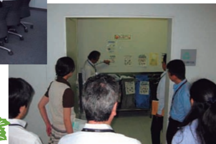
ごみの分別講習会