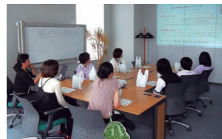
緑のカーテン講習会

あきる野テクノロジーセンターでは、家庭でも環境への取り組みを実践するきっかけづくりとして、ゴーヤを使った「緑のカーテン講習会」を開催しました。講習会の後、家庭でもすぐに始められるように、参加者にはゴーヤの苗をプレゼントしました。ほかに、当センターのごみの分別を正しく理解し、きちんと分別することがリサイクルにもつながることを学ぶ「ごみの分別講習会」を開催しました。