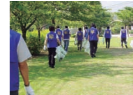
まちをきれいにする運動

三重工場では、環境月間を含め年間を通して「まちをきれいにする運動」を実施しています。環境月間の6月2日には、78名の社員が参加し、青空の下、気持ちよくごみを拾うことができました。