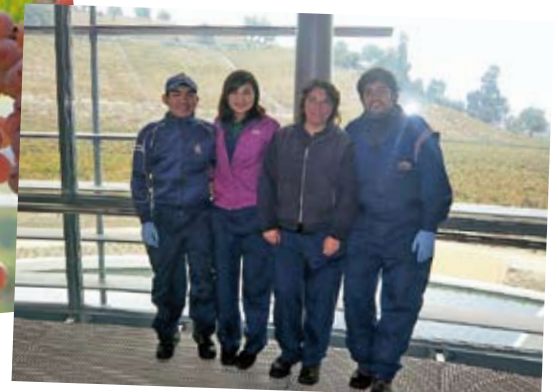
2010年春、チリの名門ワイナリー「ヴィーニャ・エラスリス」で研修。「たくさんのスタッフと仲良くなって、交流も深まりました」。