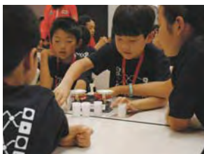
富士通キッズイベント2010

イベントは二部構成で、第一部の「楽しみながらコンピュータのしくみを学ぼう!」では、グループワークでいろいろなデータの並べ替えを試した後、地上絵の上を歩きながら複数のコンピュータが並列して処理するしくみを学びました。第二部の「富士通の技術を探検しよう!」では、スーパーコンピュータとそのアプリケーション、セルフチェックアウトシステム、海底ケーブルなど、多くの製品が展示されている「富士通テクノロジーホール」を見学し、自分たちが学んだしくみがどのように製品に活かされているかを学びました。