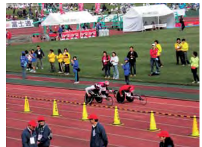
第30回記念大分国際車いすマラソン大会

アメリカンフットボール部、陸上競技部、女子バスケットボール部の活動とともに、さまざまなフィールドで挑戦する人への応援を通じ、挑戦への支援を続けていきます。