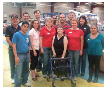
ボランティア作業に参加した社員たち

この活動の目的は、仕事を通して障がい者の方々の能力発揮を支援することにあります。参加した社員にとっても、地域社会との共生や人とのつながりを認識する貴重な機会となりました。