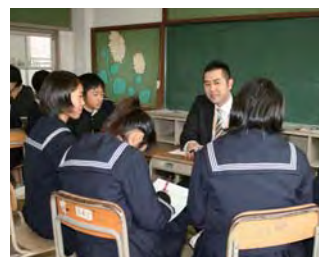
中学校への出前授業の様子

富士通デザインが川崎工場では携帯電話デザインの職場体験を受け入れたり、富士通グループとしてNPO主催のキャリア教育プログラムでの出前授業に参加したりするなど、積極的に教育支援活動に取り組んでおり、継続的に各地域でのキャリア教育を支援しています。