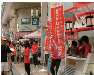
どこいこサービスご紹介ブース

「どこいこサービス」は、競演場や演舞場の混雑状況などをリアルタイムで把握・集約し、インターネット上で情報提供するサービスです。踊り子チームは、この情報を参考に「少ない待ち時間ですむように」「一つでも多くの会場で演舞できるように」踊る場所を決定し、エントリーすることができます。一方、観客もエントリー情報をウェブサイトで確認し、踊り子チームを先回りして見ることが可能になります。このように「どこいこサービス」は、よさこい祭りの効率的な運営に貢献しています。