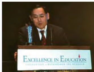
表彰式でのスピーチ

こうした活動が評価され、2011年4月、テキサス州リチャードソン独立学区から、地域に貢献する企業に対する賞としては最高の「優秀リーダーシップ賞」が授与されました。