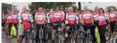
チャリティ自転車走に参加した社員たち

当日のために就業後にトレーニングを重ねてきたFTEL社員たちは、シェイクスピアの生誕地など素晴らしい景色を楽しみながらコースを完走しました。このチャリティ自転車走により、FTELは7,500ポンド(約100万円)をBHFに寄付しました。