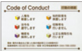
The FUJITSU Wayを記した「スモールカード」を作成、グループ全社員に配付することで、お客さまやお取引先への対応や日々の仕事の判断で迷った際に立ち戻るべき原理・原則を確認できるようになりました。

富士通グループでは、The FUJITSU Wayの「行動の規範」において法令および社会規範の遵守の姿勢を明確に打ち出しているほか、社内規範として遵守されるべき事項を定め、社員に周知・徹底することでコンプライアンスの徹底を図っています。