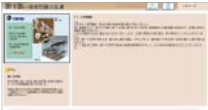
eラーニング教材「環境の基礎」(新入社員向け)

全部門に共通の教育です。各階層に応じ、環境問題についてベースラインとなる知識を身につけます。座学教育およびeラーニング教材を用いた融合教育を実施。2003年度より幹部社員向けのeラーニング教育も実施します。