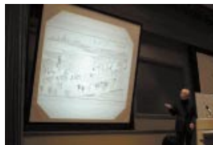
作家の石川英輔氏をお招きした講演会(富士通川崎工場)

2002年11月には、江戸学に造詣の深い作家の石川英輔氏をお招きし、「「環境先進国」江戸時代に学ぶ」と題して実施しました。