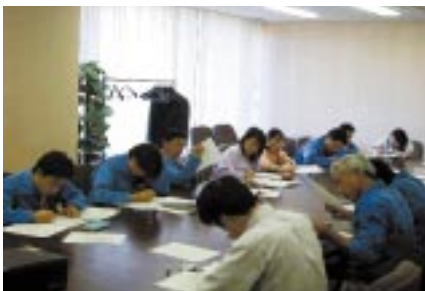
環境管理部門向け教育

専門領域に応じた技術的・専門的な教育です。設計部門、営業部門、環境管理部門、内部監査員など、各部門の職域に応じて環境に配慮した業務を行うための教育を実施。座学に加え、2003年度よりeラーニング化を推進します。