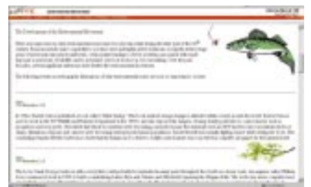
教育用資料(富士通サービス)

富士通サービスでは、eラーニング教材を活用してISO14001内部監査員教育を実施しています。また、製造拠点とする関係会社では、業務に関連した環境教育活動を推進しています。