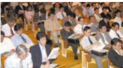
グリーン調達基準説明会(富士通川崎工場)

富士通グループ統一調査票により、お取引先の環境対応状況を調査し、国際規格に準拠した環境マネジメントシステムの構築が困難なお取引先に対し、富士通グループが定義する環境マネジメントシステムの構築・運用を要請しました。要請にあたっては説明会を全21回開催し、グループ会社のお取引先を含め920社が参加しました。さらに、お取引先への個別支援などの実施により、2002年度末でグリーン部材の調達比率99.4%を達成しました。