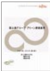
グリーン調達基準